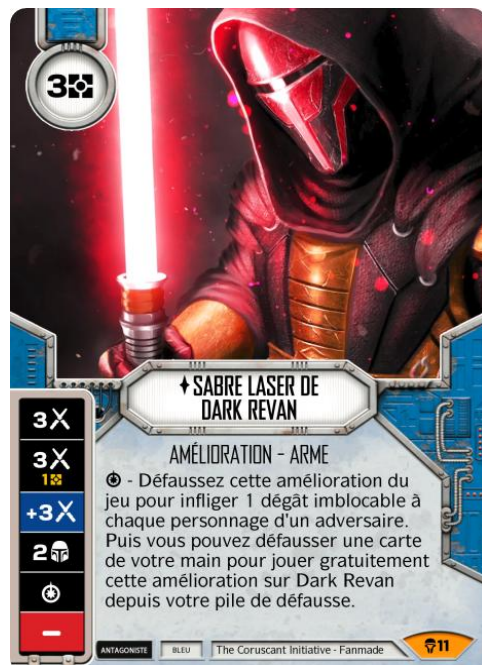
Original Art : Unknown (Youtube)