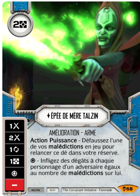
Original Art : © Lucasfilm