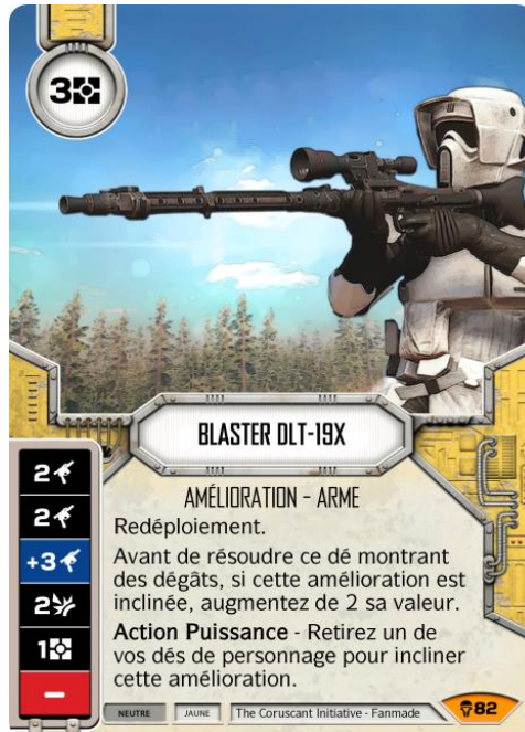
Original Art : © Electronic Arts