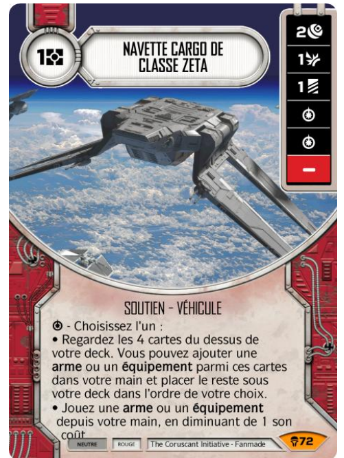
Original Art : © Lucasfilm