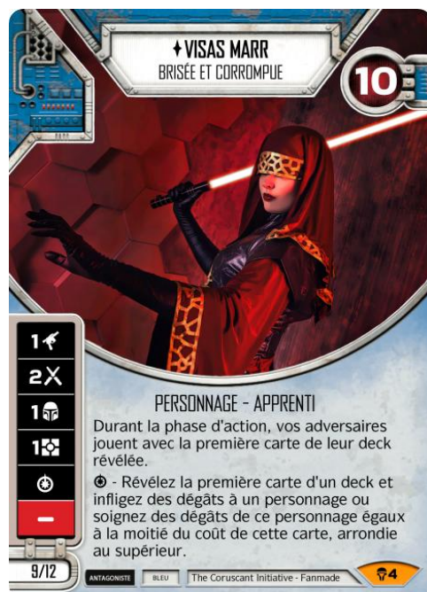
Original Art : Annie Ragnarek (DeviantArt)