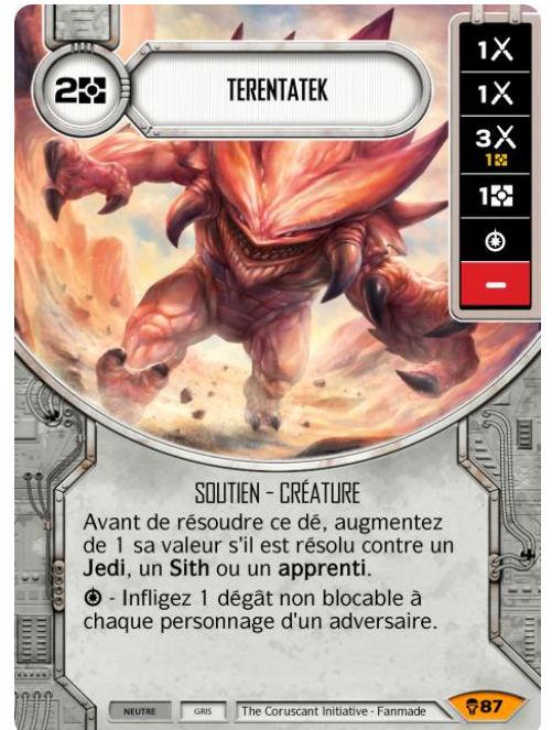
Original Art : © FFG