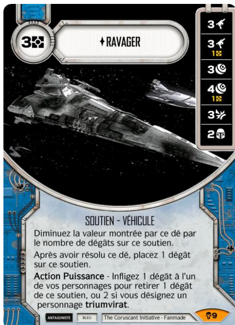
Original Art : © Electronic Arts