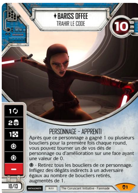
Original Art : © Lucasfilm

In order to accommodate a request we have received from some players, the following cards do not include the parallel dice miniature. In order to use them while keeping an acceptable board state during your games, you must play with dice matching the artwork of the cards you are going to play with.