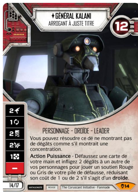
Original Art : © Lucasfilm