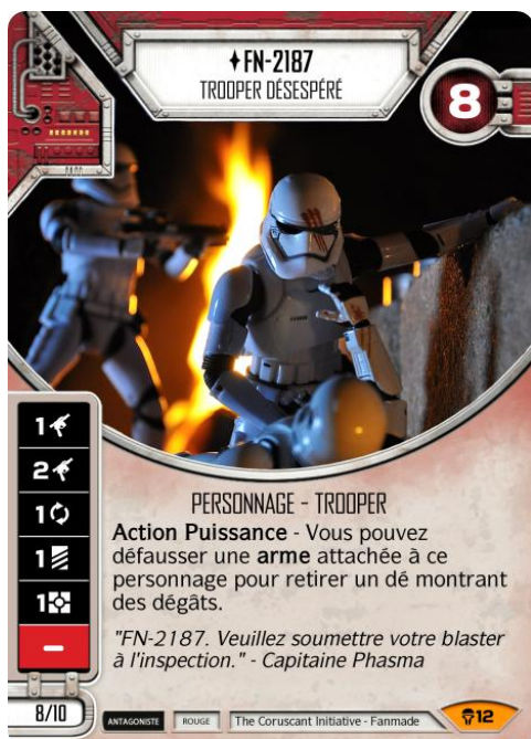
Original Art - Courtesy Of : Sean Kenary