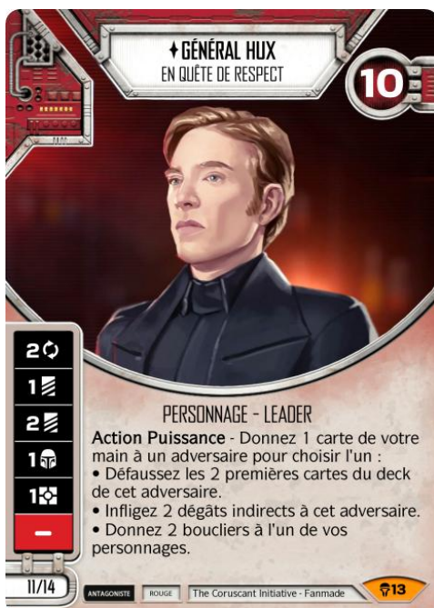
Original Art : © Electronic Arts