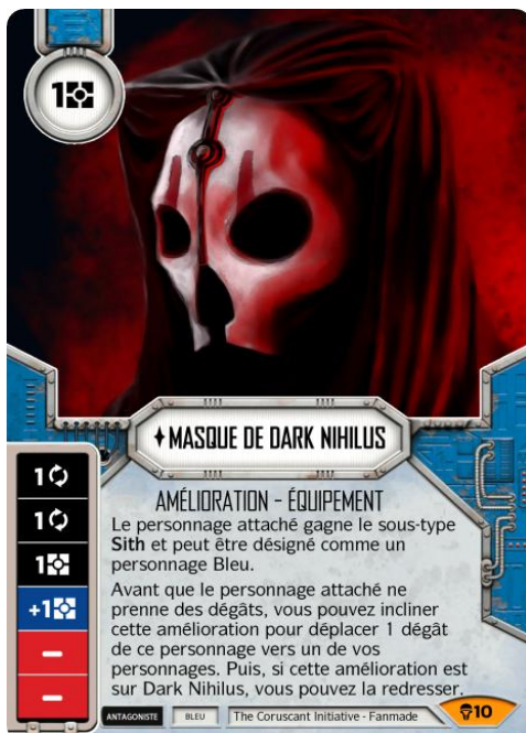
Original Art : FaceFullOfGarbage (DeviantArt)