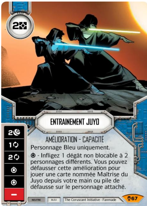
Original Art : Pepe Larraz © Marvel Comics