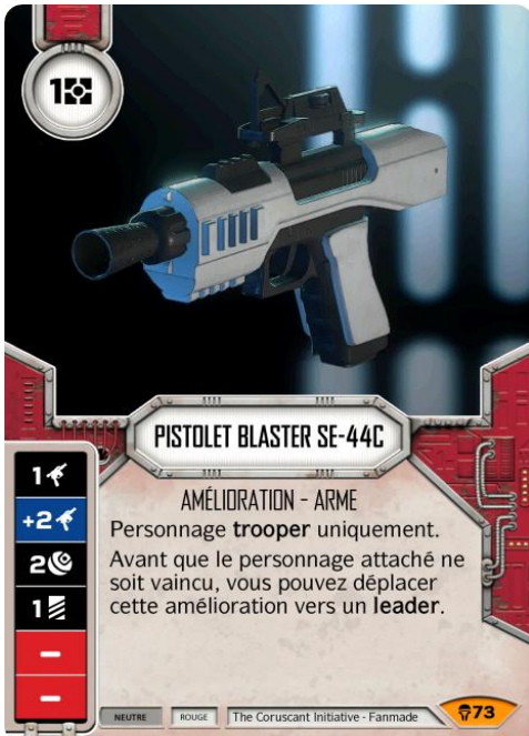
Original Art : © Electronic Arts